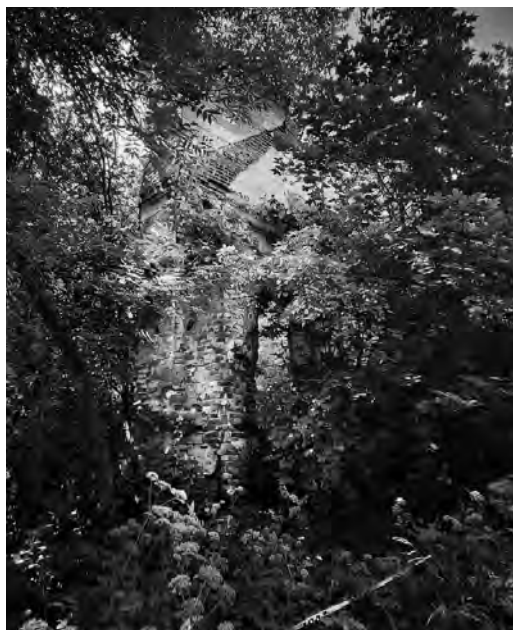
Daudžgirių dvaro liekanos 2025 m.