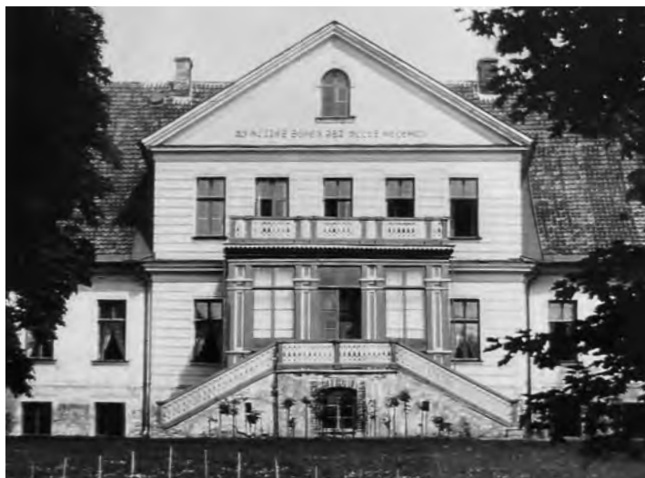
Daudžgirių dvaras XX a. pradžioje.

Gulbinų dvaras galėjo atitekti Wilhelmui (Billui), bet pats jis apie tai nieko nepasakojo. Didžiąją dalį vaikystės ir jaunystės Billas praleido Vokietijoje su motina, Lietuvą aplankydamas tik retkarčiais, o paskui įsikūrė