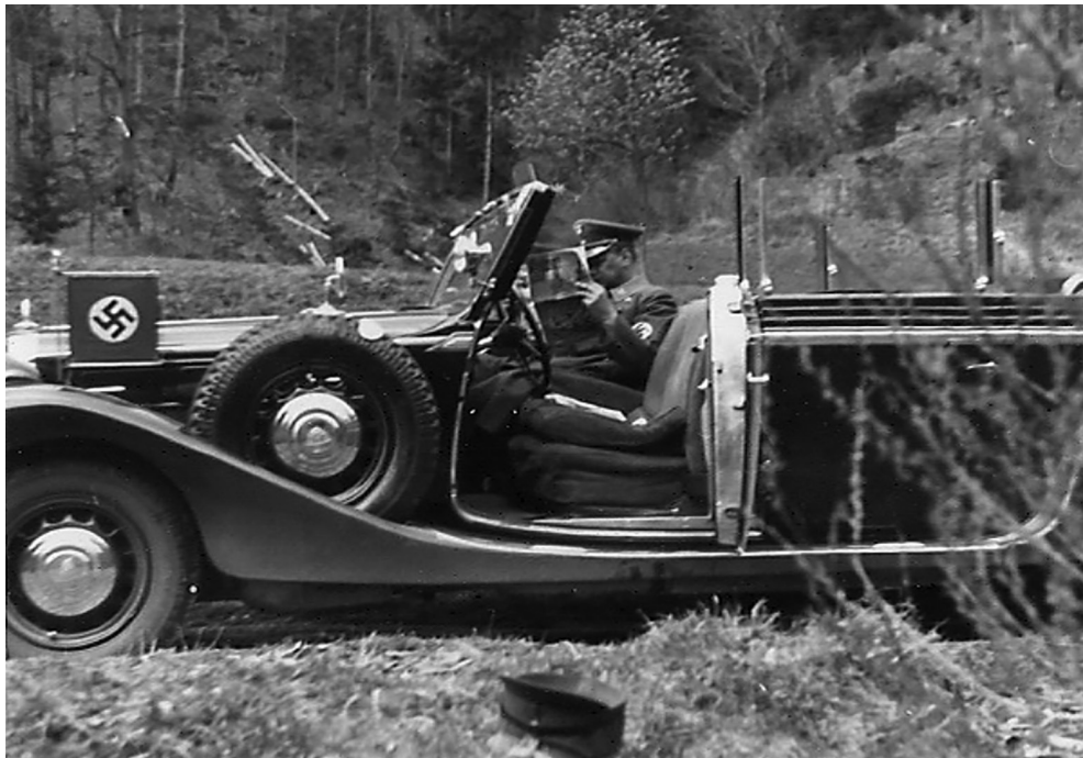
Viršuje: Alfredas Rosenbergas ilsisi savo oficialiame „Mercedes Tourenwagen“ automobilyje per pažintinę kelionę po Austriją kartu su Billu de Roppu 1938 metais.