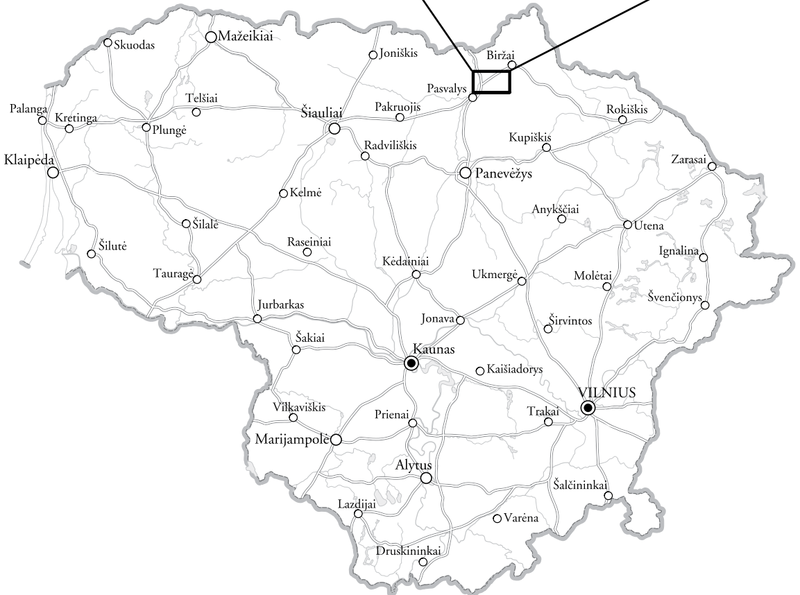
Von der Roppų giminei priklausantys dvarai Biržų ir Pasvalio apylinkėse.